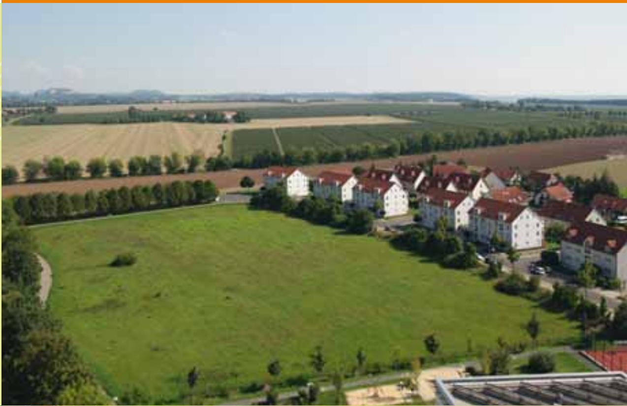
Blick auf das östliche Baufeld